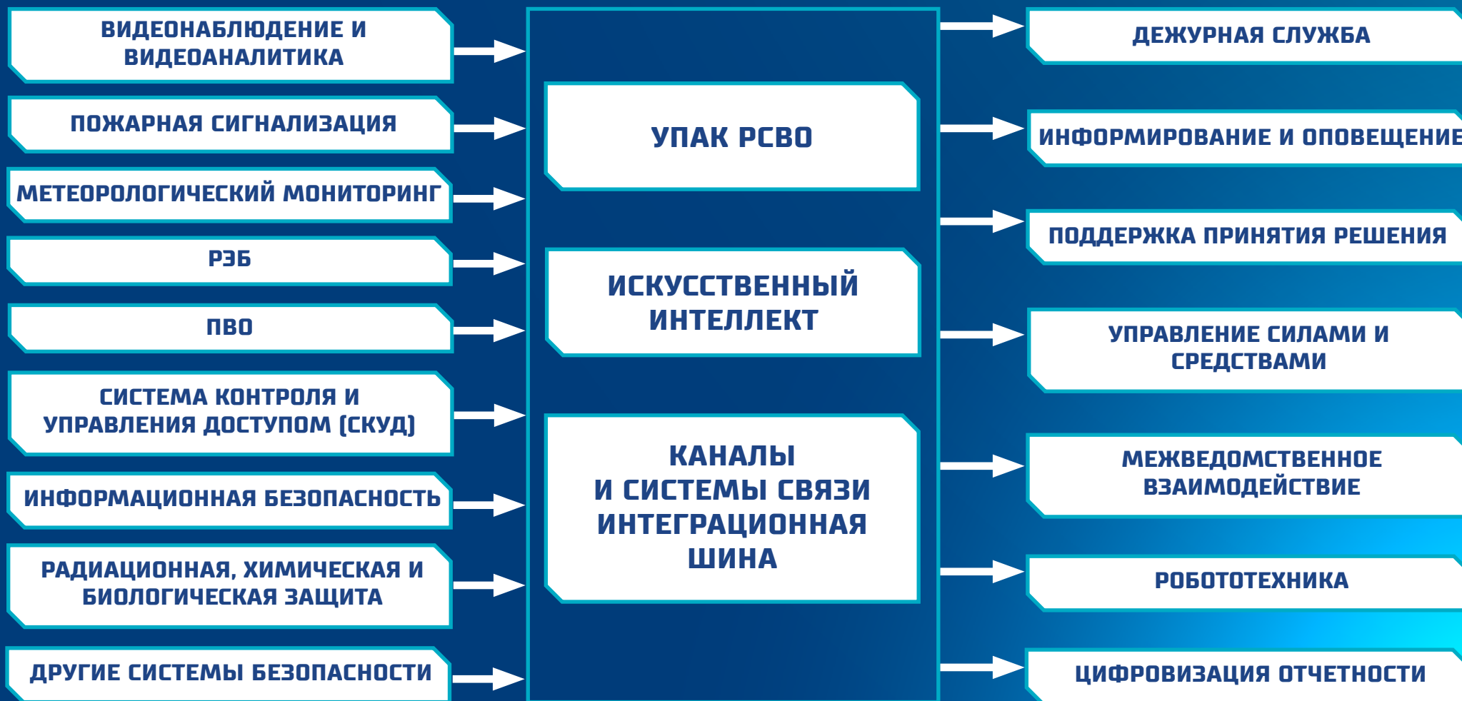
СХЕМА ФУНКЦИОНИРОВАНИЯ УПАК РСВО